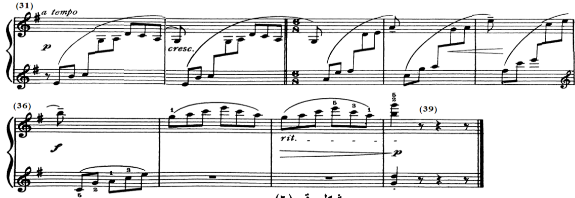
شكل رقم (٦)

جاءت إعادة بالتصوير للجملة الأولى من م(١)- (١١) مع ملاحظة تغيير الميزان م(٣٣) والتبطين م(٣٨)، وتنتهي الجملة الثالثة بقفلة تامة في سلم صول/ك، والشكل التالي يوضح ذلك.